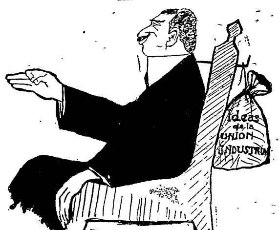
DIPUTADO SEGUI: Yo defiendo las ideas de la Unión Industrial, señor presidente...